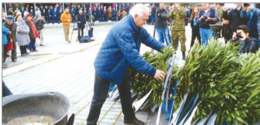
Ο Πρόεδρος του Σωματείου καταθέτει το στεφάνι

Το Σωματείο μας στις 25 Νοεμβρίου 2018 τίμησε με την παρουσία του τους αγωνιστές της Ενωμένης Εθνικής Αντίστασης συμμετέχοντας στην εκδήλωση που πραγματοποιήθηκε στον χώρο του Γοργοποτάμου. Τίμησε την ημέρα αυτή όπου όλοι οι Έλληνες ενωμένοι κατόρθωσαν να δώσουν ένα μάθημα στον Γερμανό κατακτητή. Η σημασία της ανατίναξης της γέφυρας του Γοργοποτάμου ήταν ένα στρατηγικό χτύπημα κατά των Γερμανικών εμβολέων στη χώρα μας και ένα μάθημα ότι δεν υπάρχουν αήττητοι στρατοί. Ήταν όμως και ένα δίδαγμα για όλους ότι όταν είμαστε ενωμένοι μπορούμε να κάνουμε θαύματα και ως ένα θαύμα μπορεί να θεωρηθεί αυτό που έκαναν ο Άρης Βελουχιώτης και ο Ναπολέωντας Ζέρβας μαζί με τους Άγγλους σαμποτέρ στις 25 Νοεμβρίου 1942 με την ανατίναξη της γέφυρας του Γοργοποτάμου που είχε σαν αποτέλεσμα όχι μόνο την αναπέρωση του ηθικού των λαών που ήταν κάτω από την Γερμανική μπότα