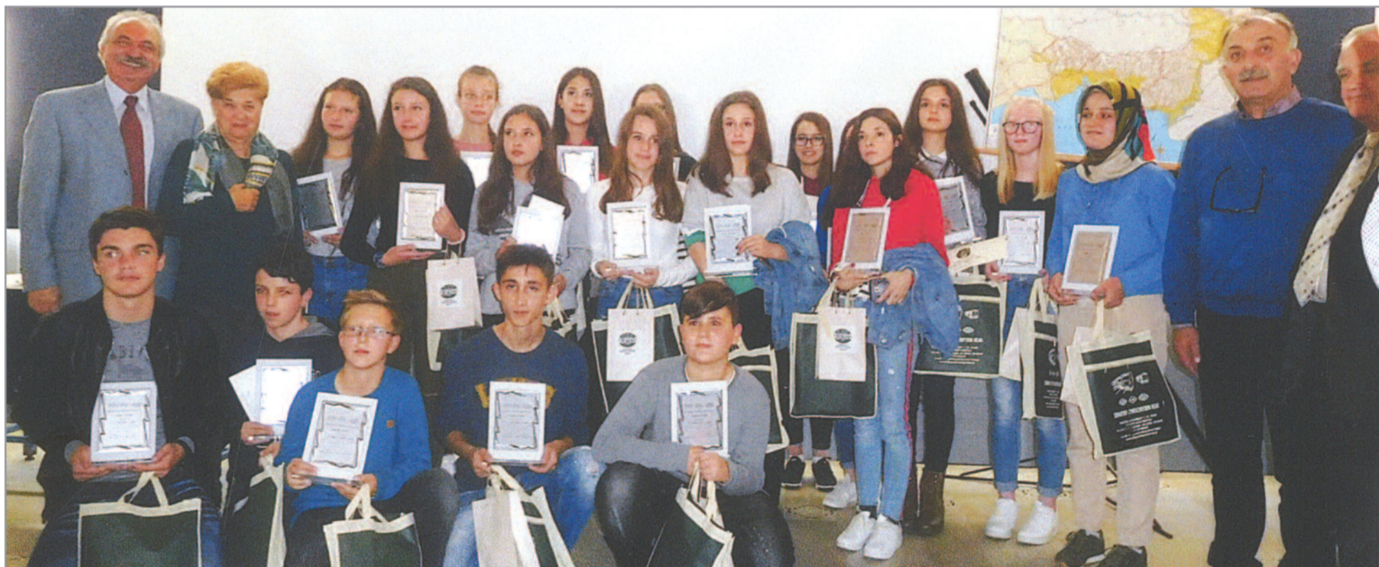
Περισσότερα νέα και φωτογραφίες από την εκδήλωση στο επόμενο φύλλο του «Ηλεκτρικού»