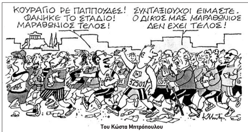
Του Κώστα Μητρόπουλου

Σας κάνουμε δε γνωστό ότι οι προσκλήσεις είναι προσωπικές για τον κάθε ένα συνάδελφο και συναδέλφισσα και σε καμία περίπτωση δεν θα χορηγούνται μέσω τρίτων. Αγαπητοί συνάδελφοι για να μην δημιουργηθούν προστριβές και παρεξηγήσεις την ημέ-