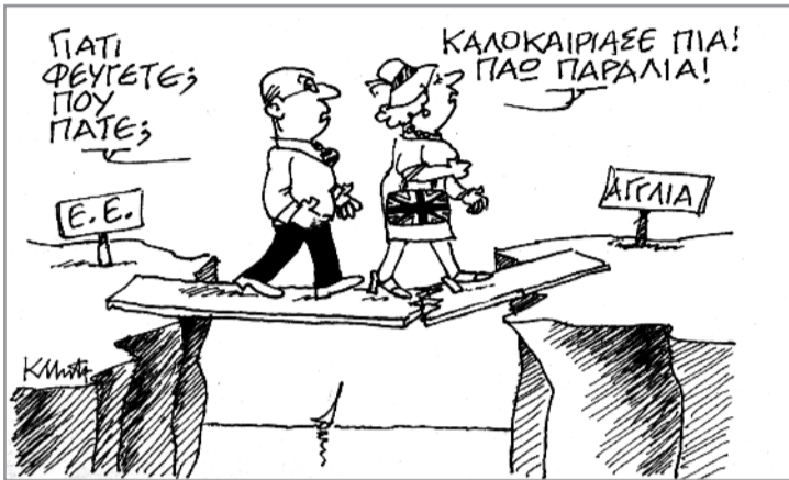
Του Κ. Μητρόπουλου