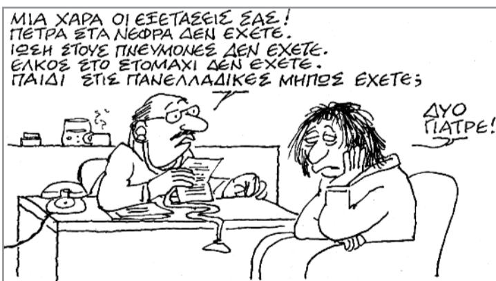
Του Κ. Μητρόπουλου