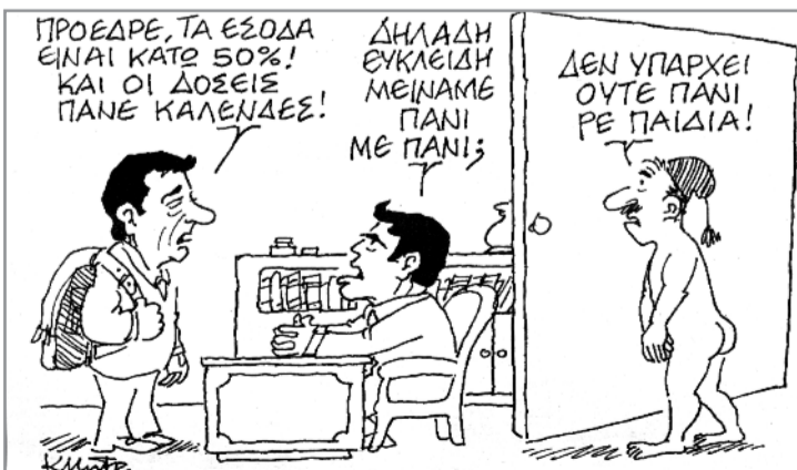
Του Κ. Μητρόπουλου