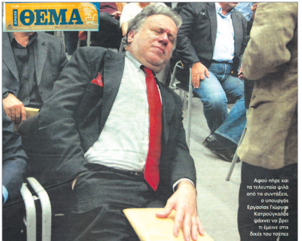
Αφού πήρε και τα τελευταία ψιλά από τις συντάξεις, ο υπουργός Εργασίας Γιώργος Κατρούγκαλος ψάχνει να βρει τι έμεινε στις δικές του τσέπες