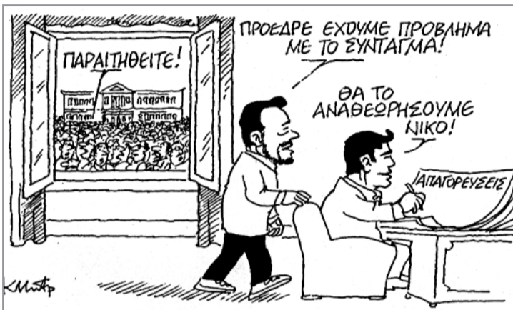
Του Κ. Μητρόπουλου