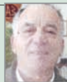
Προέδρου της Πολιτιστικής Ενώσεως Περάματος

Σας αρέσει να δημιουργήτε καταστάσεις «εκ του μη όντως».