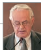
Του Προέδρου Ευθυμίου Ρουσιά

Πολύτιμο πράγμα η Ειρήνη. Από αυτήν εξαρτάται η ανοδική πορεία ενός τόπου, είναι απαραίτητα για την συνύπαρξη των λαών μεταξύ τους, αρκεί να σκεφτούμε ότι θα πρέπει να έχουμε φιλειρηνική στάση έναντι των συνανθρώπων μας. Ο κόσμος με τις πράξεις του έχει πει εγωιστικά αρκετές φορές ότι στη θεία δωρεά της Ειρήνης. Τα έργα του δεν βοηθούν την εδραίωσή της. Ίσα-ίσα εξοπλίζεται διαρκώς, δαπανώντας πλούτο όχι για άμυνα,