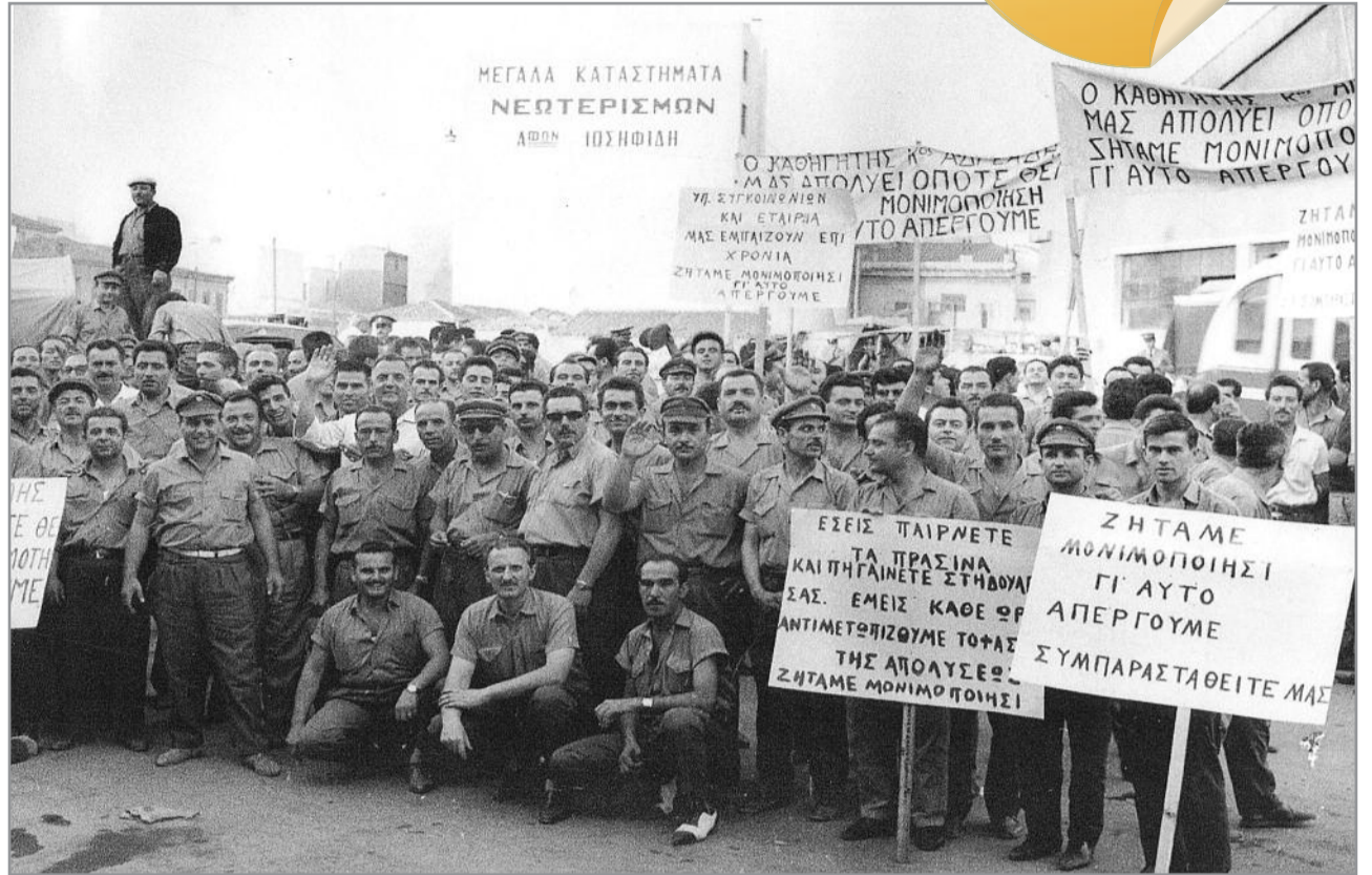
Εικόνα από την Εξαήμερη Απεργία των Εργαζομένων στους ΕΗΣ τον Ιούλιο του 1964 επί Προεδρίας Πέτρου Ψαρόγιαννη

Δικαιωμένος και καταξιωμένος γιατί εκπλήρωσε τέλεια και απόλυτα το χρέος του προορισμού του, κατά την διάρκεια της προσωρινής γήινης τροχιάς του.