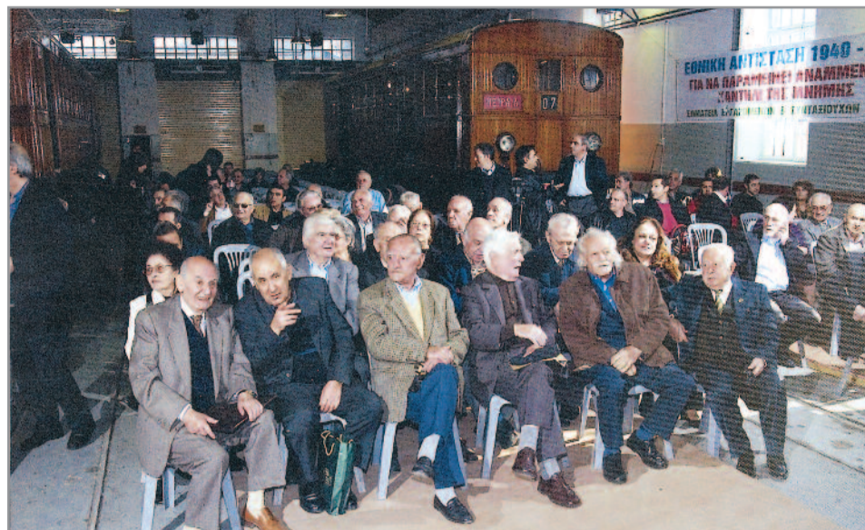
Από την εκδήλωση για την Εθνική Αντίσταση στο χώρο του Εργοστασίου με πρωτοβουλία των Σωματείων Εργαζομένων και Συνταξιούχων του ΗΣΑΠ στις 7 Δεκεμβρίου 2006.