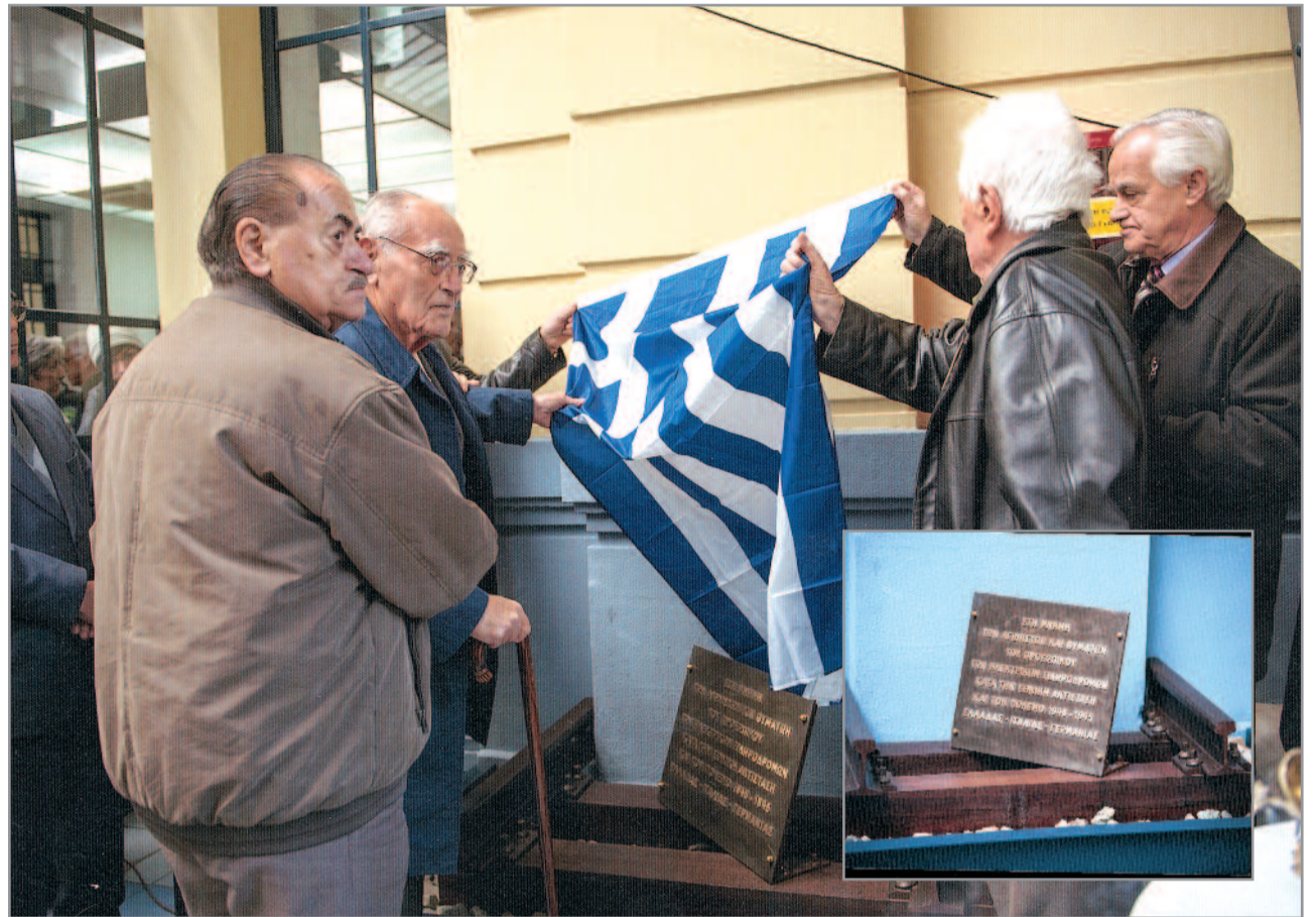
Από τα Αποκαλυπτήρια του Μνημείου της Εθνικής Αντίστασης στις 18 Δεκεμβρίου 2013